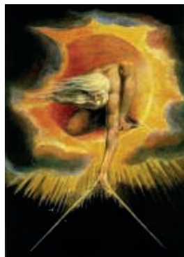
William Blake, Ancient of Days/ De Ouden der Dagen/ De Schepper (1794)