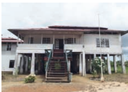
De directeurswoning, nu een museum

Om het te bekostigen deed ze dezelfde vaartochten ook voor toeristen. Met een paar vriendinnen heb ik de tocht ook gemaakt. We hebben 3 plantages bezocht o.a. de plantage Mariënburg. Op iedere plantage zie je een sluis voor de afwatering. Soms zie je ze midden in het landschap, dat is altijd een teken dat daar een plantage was, de meeste plantages zijn overwoekerd door het oerwoud, maar sommige zijn weer in bedrijf genomen, of die dicht bij de stad lagen zijn woonwijken geworden.